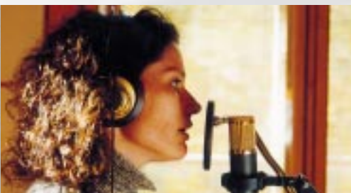
Weightless (above left)