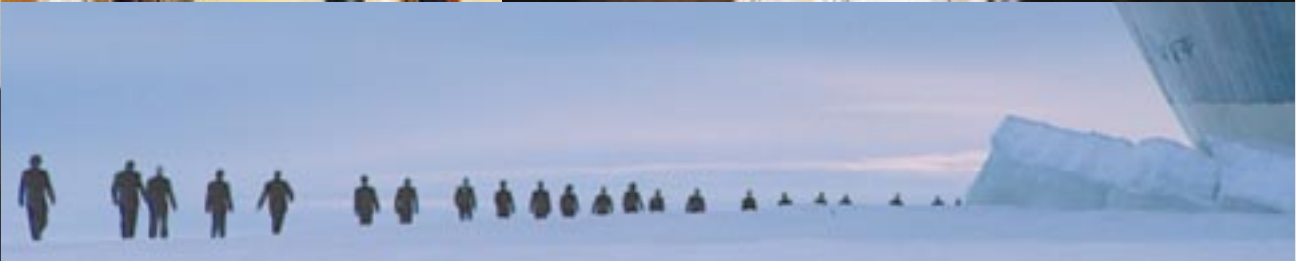
Screaming Men (below)