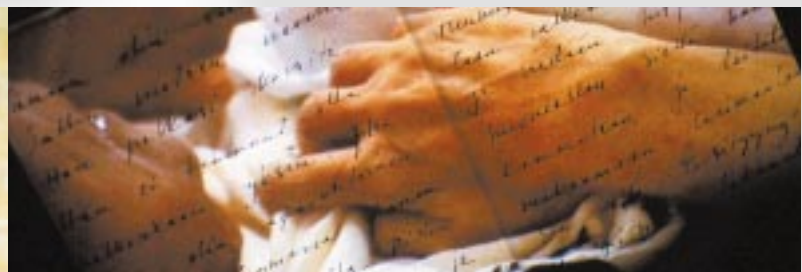
The Face of Death (above right)