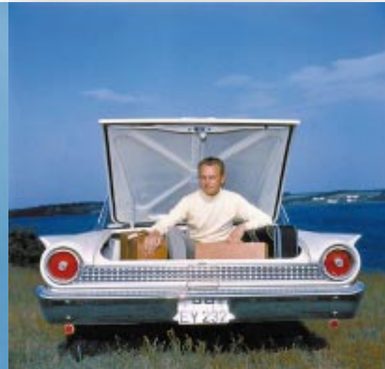
Strangers in the Night – The Bert Kaempfert Story