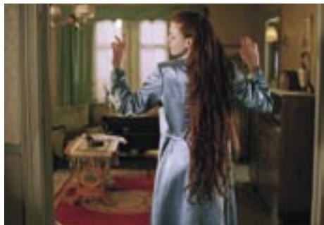
The Seagull's Laughter