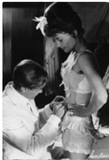
Mai Zetterling: Loving Couples

Alongside a small tribute to these famous women of stage and screen, the festival turns its attention to strong women directors in this year's Retrospective.