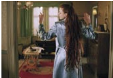
The Seagull's Laughter

Starke, unabhängige Frauen finden wir in vielen Sparten der diesjährigen Filmtage – Frauen wie die Titelfigur von „I am Dina“, gespielt von Maria Bonnevie, oder die wunderschöne, mythisch anmutende Freya, verkörpert von Margrét Vilhjálmssdóttir, die in Ágúst Guðmundsson's „Möwengelächter“ allen Männern den Kopf verdreht, aber ihre