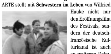
Schwester im Leben

ARTE stellt mit Schwestern im Leben von Wilfried Hauke nicht nur den Eröffnungsfilm des Festivals, sondern der deutsch-französische Kulturkanal ist auch an weiteren Dokumentarfilmen und Spielfilmen des Programms beteiligt. Aki Kaurismäki's Der Mann ohne Vergangenheit und Fridrik Thor Fridrikssons Falken , der in Lübeck seine Deutschlandpremiere erleben wird, unterstreichen – im zehnten Jahr seines Bestehens – den Beitrag des Senders zur Förderung einer eigenständigen europäischen Spielfilmproduktion. Im Dokumentarbereich ist ARTE France an zwei interessanten Filmen beteiligt: Der Code (Koodi – Linusx'n Tarina, Finland/Frankreich) ist ein Porträt von Linus Torvalds, dem Erfinder des Linux-Betriebssystems, und Riga. 10 Jahre danach... (Riga. 10 gadus pec..., Lettland/Frankreich) befragt vier junge Leute zehn Jahre nach der Unabhängigkeit nach ihren Erfahrungen.