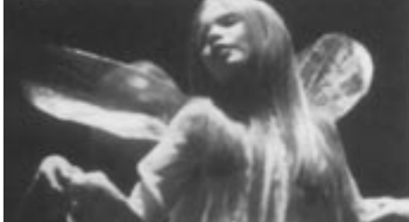
Pessi und Illusia