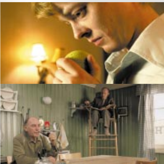
Falling Sky (above), Kitchen Stories (below)

Letztes Jahr gehörte der Besuch der 1911 geborenen Grand Old Lady des norwegischen Films, Edith Carlmar, zu den absoluten Höhepunkten der Nordischen Filmtage Lübeck. Humorvoll, erzählfreudig und interessiert an allem, was sie erlebte, gewann Edith Carlmar schnell die Herzen der Festivalbesucher. Das Festival ehrte die Filmpionierin mit einer kleinen Retrospektive innerhalb der Reihe „Amazonen des Films“. „Sie hat diesen Besuch richtig genossen“, erzählte Astri Blindheim, die sie nach Lübeck begleitete. Es sollte ihre letzte Reise, ihre letzte Ehrung sein. Edith Carlmar verstarb einundneunzigjährig am 17. Mai 2003 in Oslo.