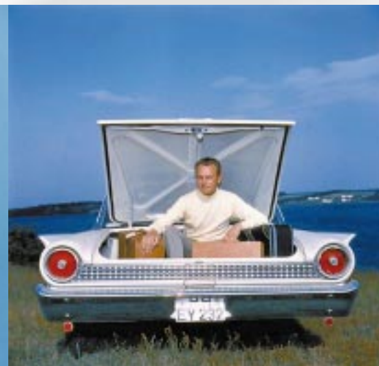
Strangers in the Night – The Bert Kaempfert Story