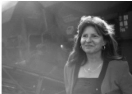
Kohle zu Kohle - von Manuel Zimmer