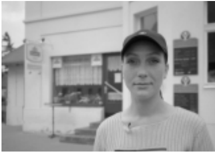
Es geht ja um Mutti - von Michael Würfel